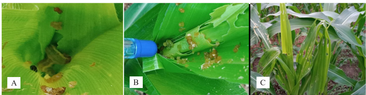
Gambar 3. Gejala kerusakan akibat larva Spodoptera frugiperda pada tanaman jagung di lokasi pengamatan. A: larva pada pucuk tanaman jagung; B: kerusakan pada saat daun masih mengulung; C: kerusakan pada daun telah membuka.