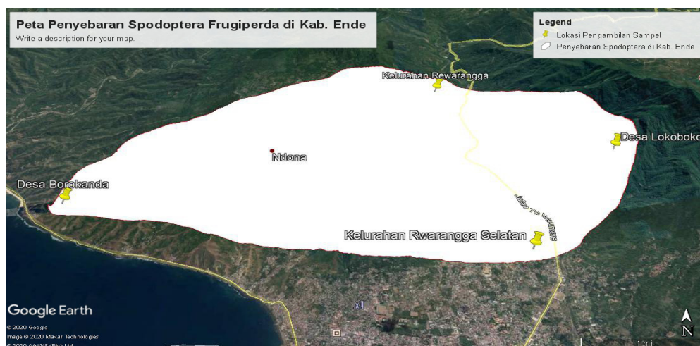
Gambar 1. Peta survei penyebaran Spodoptera frugiperda di Kabupaten Ende.

Survei tingkat serangan dan populasi UGF diamati keberadaan larva pada 200 tanaman sampel yang ditentukan secara sistematis