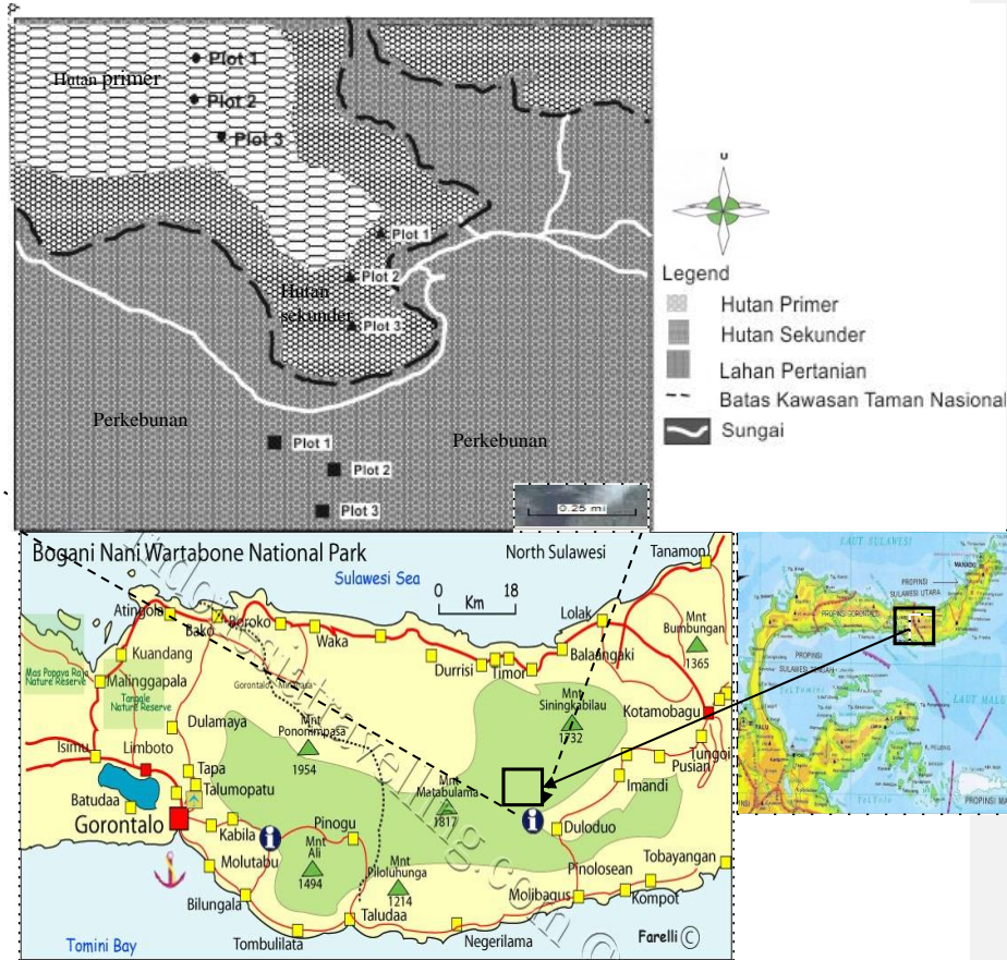
Gambar 1. Peta lokasi penelitian di Taman Nasional Bogani Nani Wartabone

1 2 3 4 5 6 7 8 9 10 11 12 13 14 15 16 17 18 19 20 21 22 23 24 25 26 27 28 29 30 31 32 33 34 35 36 37 38 39 40