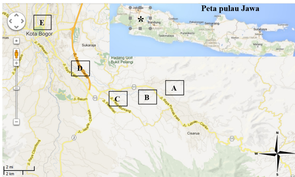
Gambar 1. Stasiun pengamatan anggang-anggang di bagian hulu sungai Ciliwung. A: Cilember; B: Cijulang; C: Gadog; D: Katulampa; E: Sempur (maps.google.co.id).

Pengukuran parameter lingkungan di setiap stasiun dilakukan selama pengamatan anggang-anggang selama 4 bulan. Suhu air, suhu udara, dan pH air masing-masing diukur dengan termometer dan pH meter. Arus air diukur dengan melempar bola pingpong pada permukaan air sungai dan dihitung waktu yang dibutuhkan pada jarak tertentu. Pengambilan sampel untuk analisis kimia air dilakukan dengan menggunakan botol sampel