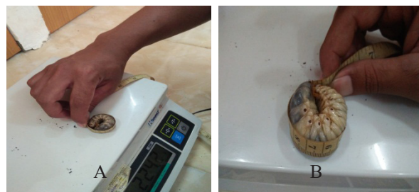
Gambar 2. Perubahan ukuran panjang larva Oryctes rhinoceros . A: panjang awal; B: panjang akhir.