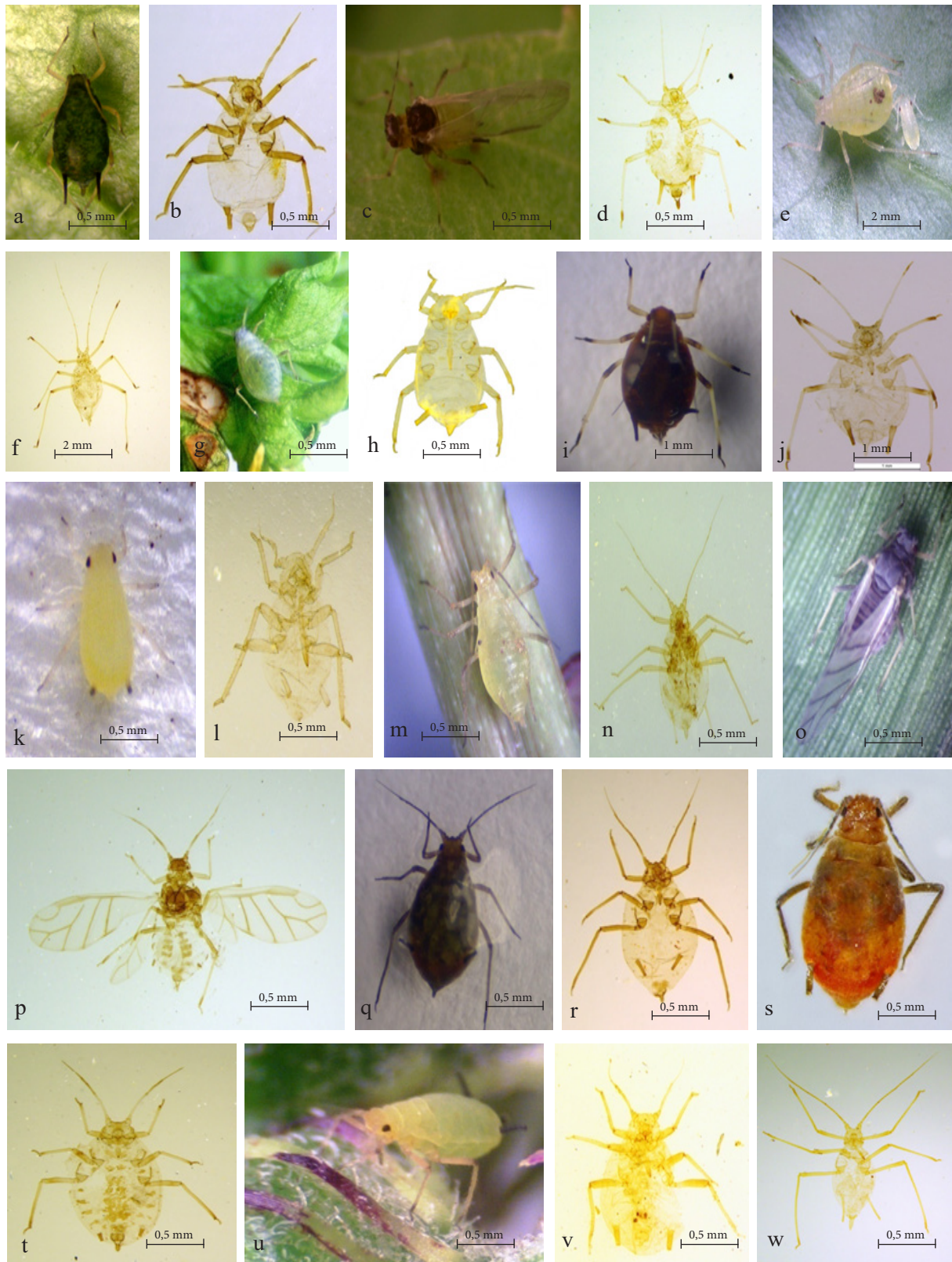
Gambar 1. Imago kutudaun a: Aphis gossypii ; b: mikroskopik A. gossypii ; c: Aphis spiraecola ; d: mikroskopik A. spiraecola ; e: Aulacorthum solani ; f: mikroskopik A. solani ; g: Epameibaphis frigidae ; h: mikroskopik E. frigidae ; i: Hysteroneura setariae ; j: mikroskopik H. setariae ; k: Melanaphis sorghi ; l: mikroskopik M. sorghi ; m: Metopolophium dirhodum ; n: mikroskopik M. dirhodum ; o: Pseudaphis sijui ; p: mikroskopik P. sijui ; q: Rhopalosiphum padi ; r: mikroskopik R. padi ; s: Rhopalosiphum rufiabdominale ; t: mikroskopik R. rufiabdominale ; u: Schizaphis graminum ; v: mikroskopik S. graminum ; w: mikroskopik Sitobion leelamaniae .